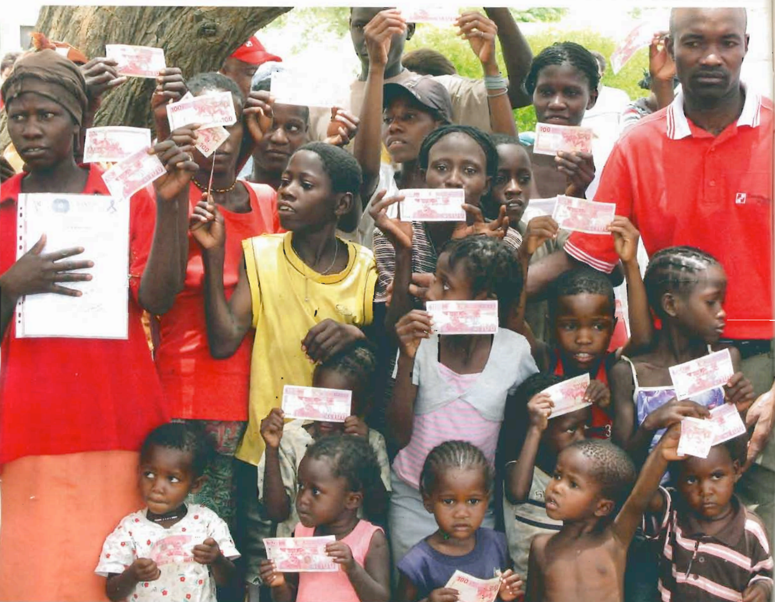
Bewohner von Otjivero mit geschenkten Geldscheinen: Der perfekte Ort, um zu testen, wie man die Welt gerechter machen kann